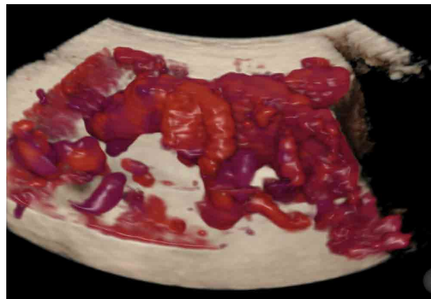
Vorderwandplacenta percreta im 3 D Colormode.