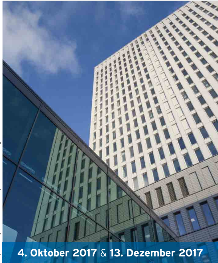
Gestaltung: Zentrale Medienserviceleistungen, Charité - Universitätsmedizin Berlin | Fotos: Archiv Klinik für Geburtsmedizin, Prof. Dr. med. W. Henrich CCR | Kinder-Jugendmed. -> Pränatal -> ProgrammPränatalmedizin2017_Ges.indd